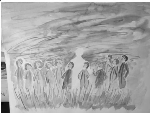
Truus Lantink De onzienbare met zijn Geest in hun midden