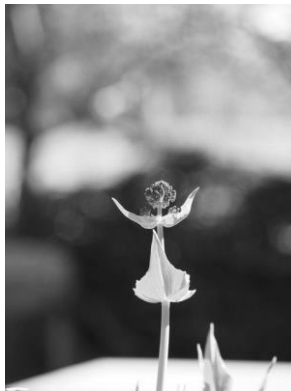
Wietske Bijker Foto 'Leer te dansen'