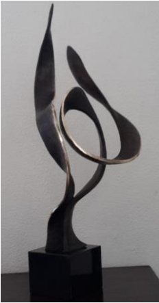
Rob Flink Beeld in brons 'De Ontstijging'