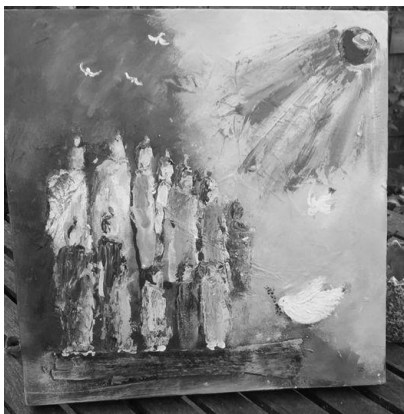
Janneke Bakker In vuur en vlam met vredesduif