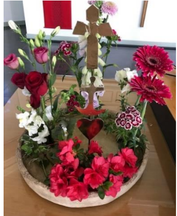
Anneke Schutte Geloof, hoop en liefde

en velen waren er samen kinderen en ouderen vrouwen en mannen donker getinte mensen en blanken homo's en hetero's en allen voelden zich aangesproken in hun eigen taal de taal van .... geloof, hoop en liefde