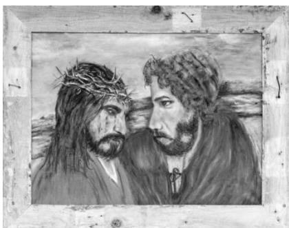
Statie 7: Simon van Cyrene Lucas 23: 26 Psalmgebed 71