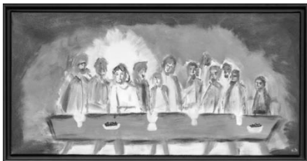
Statie 2: Pesachmaaltijd Exodus 12 Lucas 22: 7 – 20

Vandaag gedenken we dat Jezus met zijn leerlingen op de dag voor zijn sterven de Pesach maaltijd hield: matses en wijn, tekenen van bevrijding en een nieuw begin. Met een bijzondere rol voor de kinderen, die de afgelopen weken kindercatechese volgden en zich al weken op het Pesach hebben voorbereid.