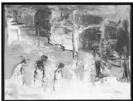
Exodus 13 Lucas 22 en 23 Psalmgebed 22

We volgen de Kruisweg vanaf de gevangenneming van Jezus op de Olijfberg tot aan zijn sterven aan het kruis op Golgotha.