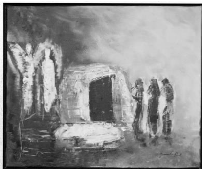
Statie 13: Het lege graf Lucas 24: 1 – 12

Deze nacht is een nacht van waken en we luisteren naar de oude verhalen van Schepping, Uittocht en Doortocht en aarzelend mogen we weten dat het nieuwe licht gaat schijnen in onze duisternis. Het graf is leeg.