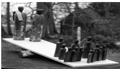
Statie 6: Voor de Joodse raad, Pilatus en Herodus

Lucas 22: 47 – 53, 63 – 23: 25 Psalmgebed 43